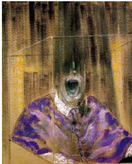
Figure 1. Francis Bacon, Tête VI .