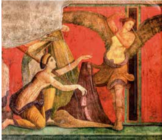
Figure 3. Mystica Vannus .

L'artiste campanien de ce que les archéologues appellent le deuxième style pompéien, qui dans les années 60 avant notre ère a peint cette Mystica Vannus sur le mur de la villa de Pompéi ensevelie au siècle après sous les cendres de l'éruption de 79, nous présente un panier à vannage qui sert de berceau d'osier au sacré membre.